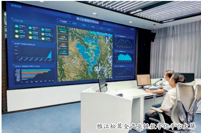
雅江松茸全产业链数字化平台数据屏

今年,中农在线团队深入开展项目二期提升工程,已实现全流程移动化结算,通过手机端即可完成全部操作,帮助用户摆脱了传统松茸销售的现金交易桎梏;完成了众多用户反馈的语音播报功能的开发攻关,在便捷方面实现再升级。团队还积极对接银行和物流公司,为用户提供相应贷款与支付抵免等金融福利,真正做到了实用、管用和好用。雅