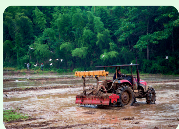
《耕种希望》