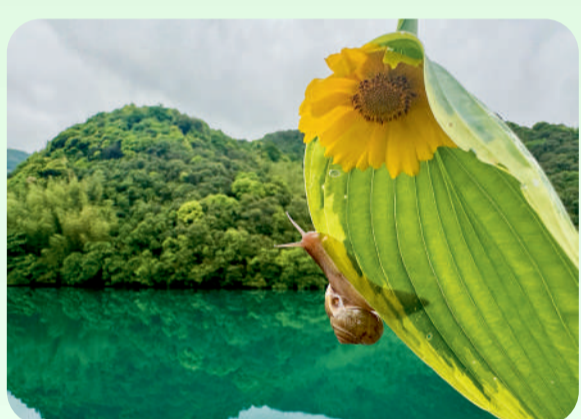
《一起看青山绿水》