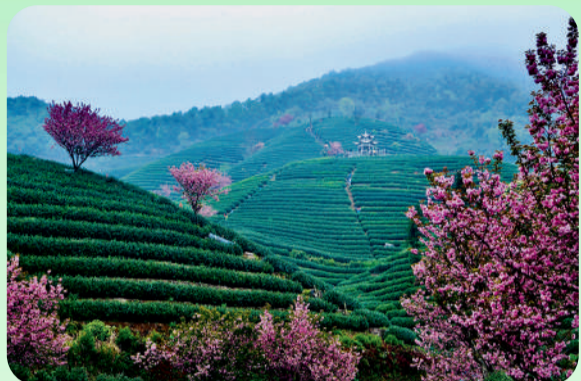
《拔山观茶》