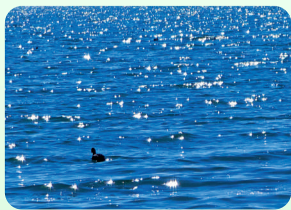
《春江水暖鸭先知》