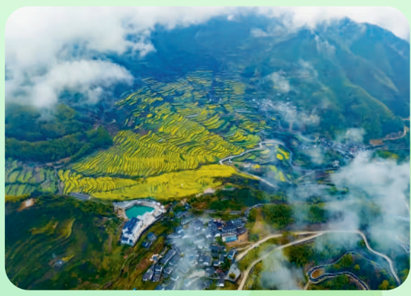
《云牵雾绕 山隐其间》