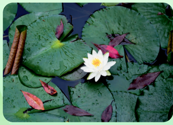
《宁静与热烈》